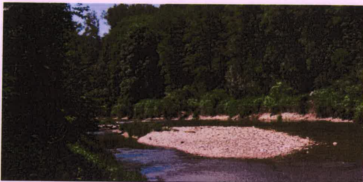
Broye Source de Vie